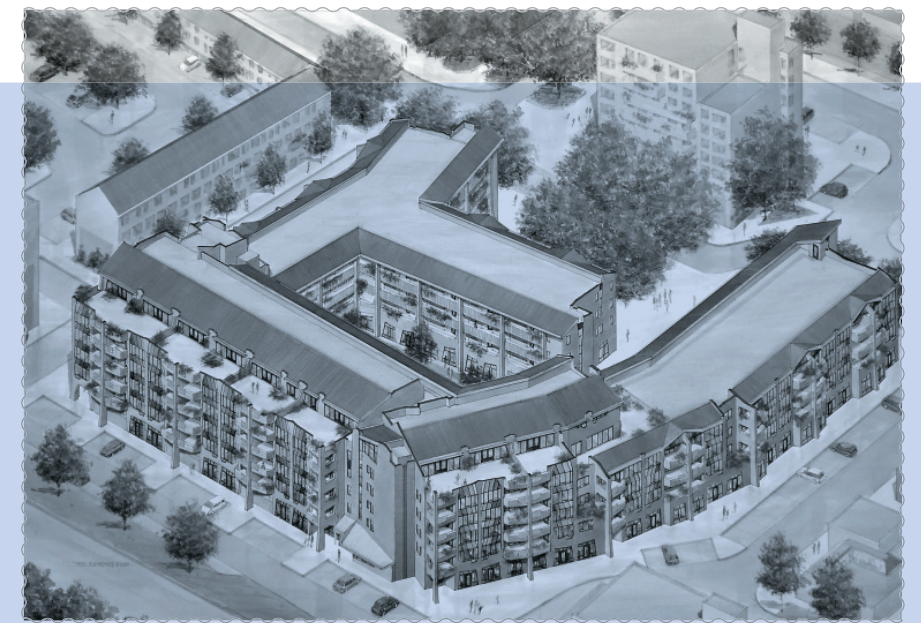
● Art impression De Nieuwe Baten